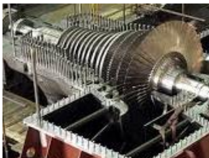
turbíny, kotle, kondenzátory