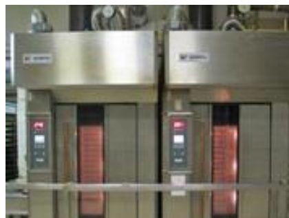
zařízení na výrobu potravin