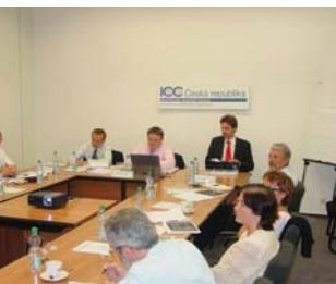
Seminář Nový zákon o veřejných zakázkách v praxi 26. 6. 2006