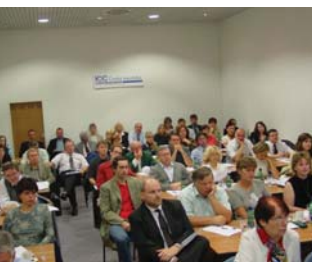
Seminář Námořní přeprava 2.2.2006