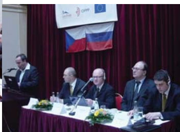
Konference Česko-Ruský obchod 29. 10. 2006