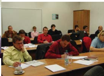
ze semináře FIDIC 30. 5. 2006