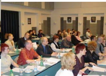
Seminář pojištění přepravních rizik v mezinárodním obchodě 30. 3. 2006