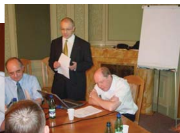
Ze semináře Bankovní záruky podle anglického práva