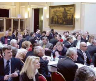
Účastníci konference Česko-Ruský obchod

je registrováno v rejstříku ochranných značek pod č. 228879.