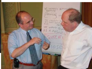
Ze semináře Bankovní záruky podle anglického práva