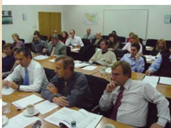
Ze semináře o mezinárodní kupní smlouvě 20. 10. 2006