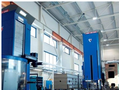
CNC brusky, vrtáčky, obráběcí stroje